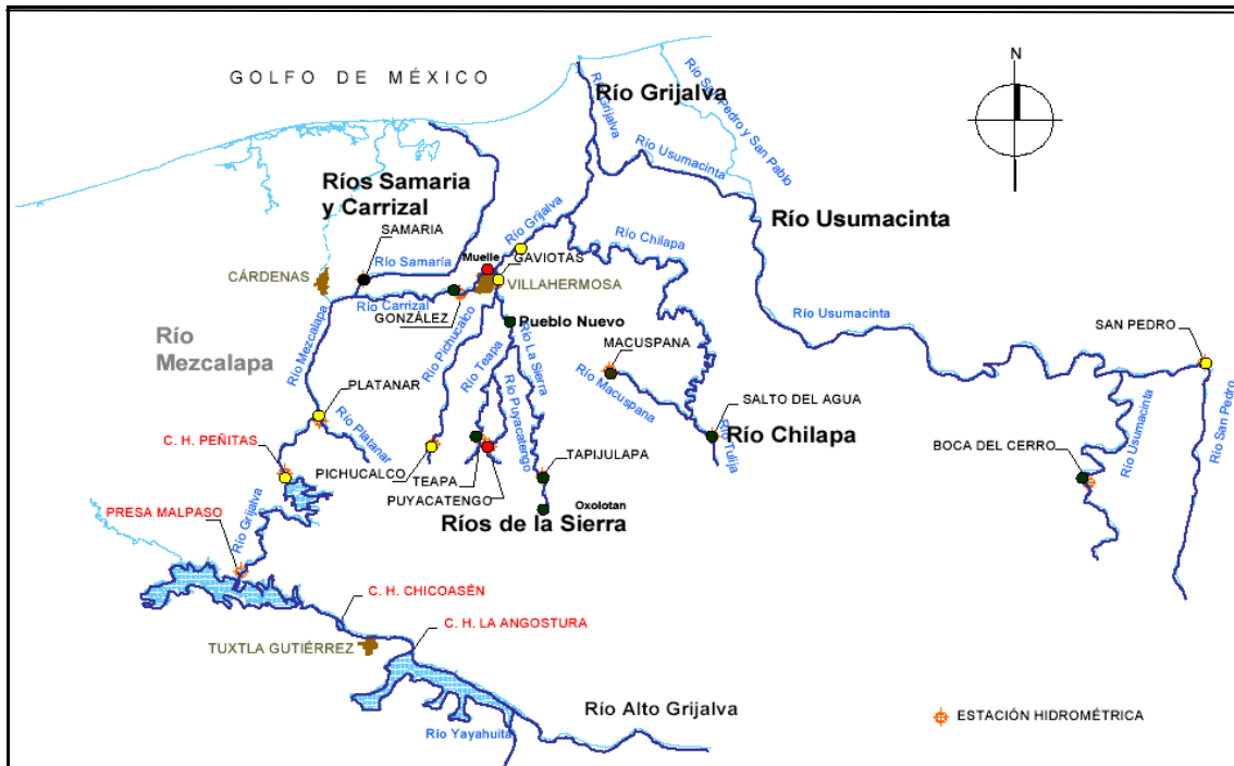
Mapa 1.- Hidrología del estado de Tabasco.

El estado de Tabasco se ubica en la confluencia y delta de los dos principales ríos de México: el Grijalva y el Usumacinta, los cuales suman aproximadamente el 30% del total del escurrimiento de México. El río Grijalva se encuentra parcialmente controlado por un sistema de presas de generación de energía que cumplen también la función de control de crecientes.