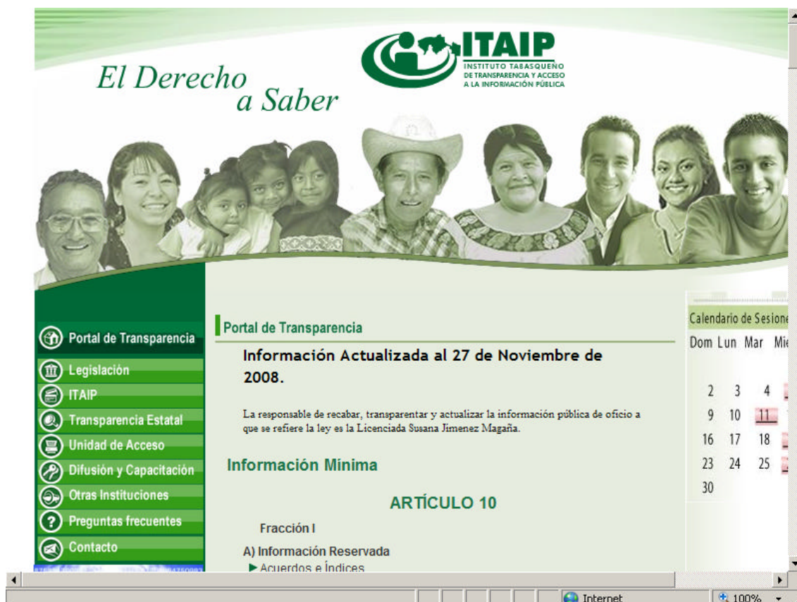
Figura 1. Portal de Transparencia del ITAIP ( http://www.itaip.org.mx/portal_transparencia.htm ).